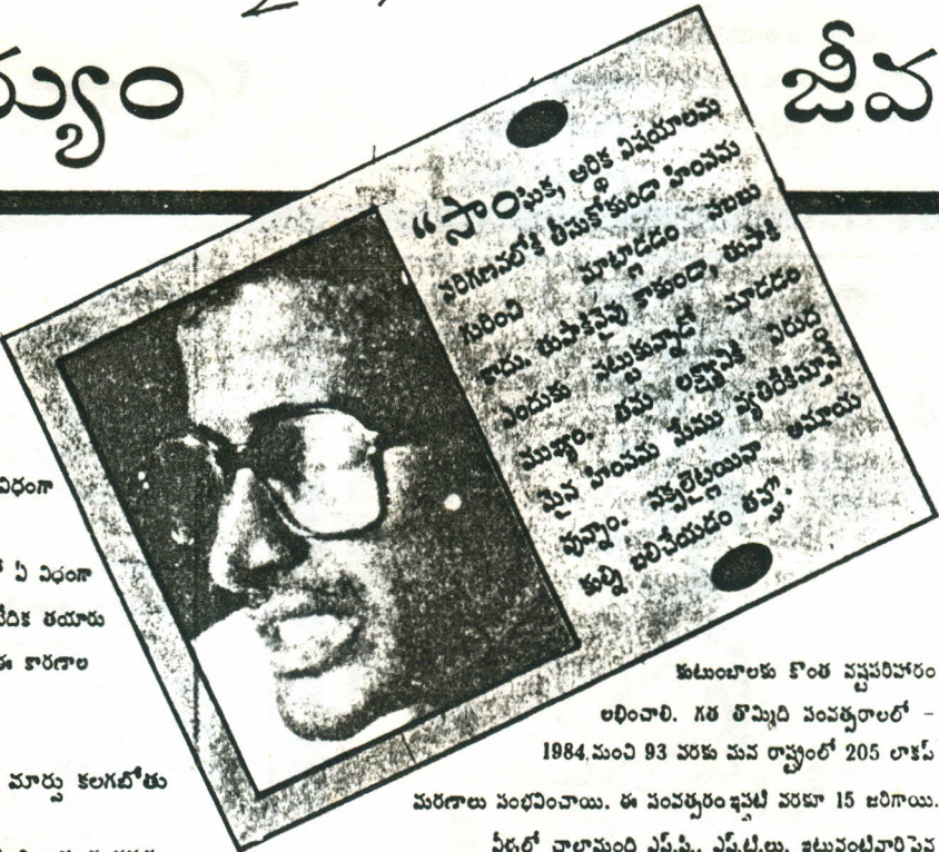
కుటుంబాలకు కొంత నష్టపరిహారం అందించారు. గత తొమ్మిది సంవత్సరాలలో - 1984 నుంచి 93 వరకు మన రాష్ట్రంలో 205 లాకప్

జ: ఎన్కౌంటర్లో చనిపోయిన వ్యక్తుల కుటుంబాలకు కనీసం పునరావాసం ములతరం కావాలని ఆశిస్తున్నాం. ఒక ఎకరం పొలమో, కొంత డబ్బో చనిపోయిన వ్యక్తులకు భార్య పిల్లలకు ఇచ్చేలా చూడాలని మా ఆశ. ఇంకాకాక పోలీస్ లాకప్ లో చనిపోయిన వారి