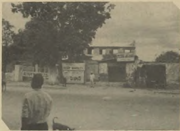
K.E. సోదరులు రాక్‌వుడ్ స్కూలు కాంపౌండు స్థలము కొనుక్కొని వేసుకున్న షాపులు