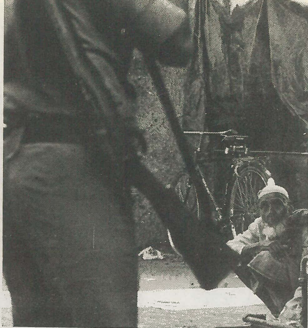
ముంబాయి అల్లర్ల దృశ్యాలు