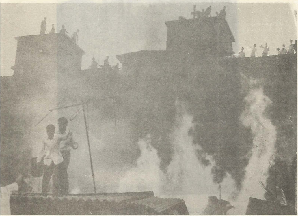
ముంబాయి అల్లర్ల దృశ్యాలు