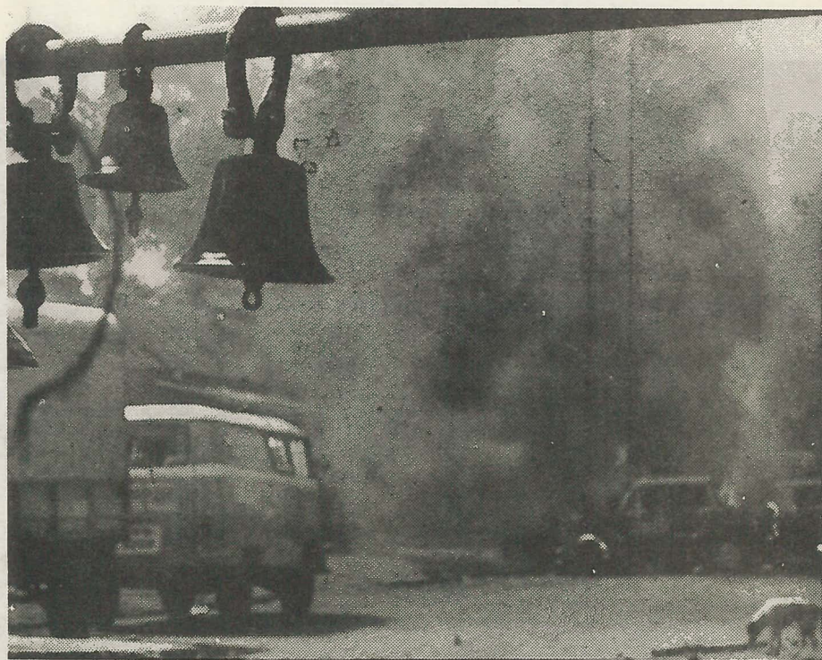
టైమ్స్ ఆఫ్ ఇండియా, సండే అబ్జర్వర్లలో వచ్చిన ఫోటోలు