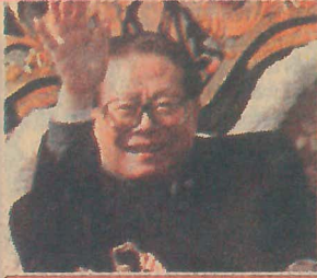
జయప్రకాశ్ నారాయణ్ చైనాలో రాజకీయ సంస్కరణలకు ఊతం ఇస్తారా?

భాగాన ఉండాలనీ ఆది రాజ్యాధికారం రూపంలో ఉండాలనీ నమ్మే మావోయిజం దృష్టికి ఇదొక బలహీనతగా కనిపించకపోవచ్చును గానీ ఇది నిజానికి తీవ్రమైన బలహీనత.