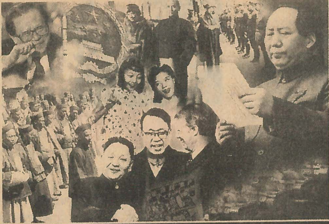
నవవైనా నిర్మాణంలో భాగస్వాములు ఎందరో!!

కానీ దానిని ఏవిధంగా అధిగమించాలన్న ప్రశ్నకు ఈ శతాబ్దంలో జరిగిన కమ్యూనిస్టు ప్రయోగాలు కచ్చితమైన జవాబు ఇవ్వలేకపోయాయి. కార్మికవర్గం తన పోరాటాల ద్వారా పెట్టుబడిదారీ వ్యవస్థను కూలదోస్తుందని నమ్మే పరిస్థితిపోయింది. ఒక వర్గానికే పరిమితం కాని విశాల