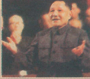
మావో మరణానంతరం చైనా 'రూట్' మార్చిన ఘనత డెంగ్‌దే!

వాత జరిగిన తియన్‌మెన్ స్క్వేర్ ఊచకోత గురించి విన్నాము. ఈ మధ్యనే టిబెట్‌లో అంతర్జాతీయ మానవ హక్కుల ప్రకటనను స్థానిక భాషలోనికి అనువదించి