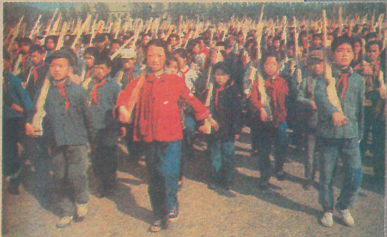
సాంస్కృతిక విప్లవం సందర్భంగా మావో ఇచ్చిన పిలుపుకు స్పందించిన వారిలో వీరూ ఉన్నారు.

చైనా- అందులోనూ మావో ఆలోచనాసరళి- ఇచ్చిందని నమ్మేవారున్నారు. సాంస్కృతిక విప్లవం అనే భావనను కొంచెం సేపు పక్కనపెట్టి చైనాలో వాస్తవంగా నడిచిన సాంస్కృతిక విప్లవాన్ని పరిశీలిస్తే, మనకు ఏ సమాధానమూ