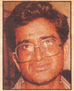
రచయిత : కె. బాలగోపాల్

తీవ్రవాదాన్ని, బెర్రరిజాన్ని కలిసికట్టుగా ఎదుర్కోవాలని ప్రపంచదేశాలు వదే వదే ప్రకటిస్తుంటాయి. పని గట్టుకొని ఇతర దేశాలలో సాయుధ మిలిటెన్సీని ప్రోత్సహించే కొన్ని దేశాలను మినహాయించి, తక్కిన దేశాలకు ఈ విషయంలో ఏకాభిప్రాయం ఉంది.