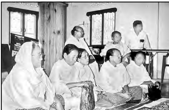
నిజనిర్ధారణ కమిటీతో మాట్లాడుతున్న మీరాపైబీలు

‘మీయరాపైబీలు’ (పలికేటపుడు మీరాపైబీలంటారు) మణిపూర్ (మీయతీ) సమాజంలోని ఒక విశిష్టమైన వ్యవస్థ. ఆ మాటకు అర్థం మహిళా వైతాళికులు అని. వీళ్లు వివాహిత స్త్రీలు. ప్రతీ ఇంట్లో ఒక వివాహిత స్త్రీ ‘మీయరాపైబీ’ కావాలి. అంటే సామాజిక కార్యకర్త కావాలి. సామాజిక జీవితంలో ఏదయినా సమస్య లేక సంక్షోభం తలెత్తినప్పుడు స్థానిక మీయరాపైబీలు ఎవరూ పురమాయింపకుండానే తమంతట తాము రంగంలోకి దిగి దానిని పరిష్కరించే ప్రయత్నం చేస్తారు. ఇది ఎప్పటినుండో వస్తున్న సంప్రదాయం. వారి అలిఖిత అధికారాన్ని అందరూ గౌరవిస్తారు. మణిపూర్ లో మిలిటెన్సీ మొదలయిన తరువాత మీయరాపైబీలు తమంతట తాము ఒక కొత్త పాత్ర నిర్వహిస్తున్నారు. సైనిక జవాన్లు, పోలీసులు లేక మిలిటెంట్లు గ్రామంలోకి వచ్చి ఎవరినయినా కొట్టినా, బెదిరించినా, పట్టుకుపోయినా స్థానిక మీయరాపైబీలంతా వెంటనే జమ అవుతారు. వచ్చిన సాయుధులను నిలదీస్తారు. పట్టుకుపోయిన వ్యక్తిని విడిపించడానికి ఆందోళన చేస్తారు.