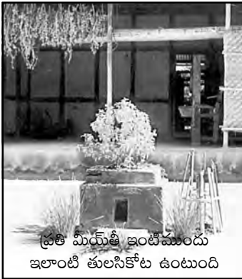
ప్రతి మీయ్‌తీ ఇంటిముందు ఇలాంటి తులసికోట ఉంటుంది

అయితే బెంగాల్ నుండి వైష్ణవ మతం మాత్రం 18వ శతాబ్దం నాటికి మణిపూర్‌కు వ్యాపించింది. మీయ్‌తీలు వైష్ణవులయ్యారు. కుల వ్యవస్థ కూడా అంకురించింది. ఆహార పానీయాల విషయంలో సంప్రదాయక మీయ్‌తీ ఆచారాలు ఇంకా పాటించే చక్కాలను అంటరానివారిగా భావిస్తారు. 18వ శతాబ్దపు ప్రథమార్ధంలో మణిపూర్‌ను పరిపాలించిన పమ్‌హీయ్‌బా అనే రాజు వైష్ణవం స్వీకరించడమే కాక వైష్ణవాన్ని మణిపూర్‌లో అధికార మతం చేశాడు. కానీ అది