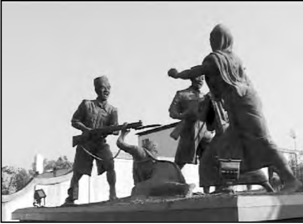
బ్రిటిష్ సైనికులతో పోరాడుతున్న మణిపూర్ స్త్రీల స్థూపం

ఆపమని ఆందోళనకారులతనిని అడిగారు. రాజాజ్ఞ లేకుండా నేనెట్లా ఆపేది అని అతను తిరస్కారంగా జవాబు ఇచ్చాడు. అయితే రాజుకు టెలిగ్రాం ఇద్దువు పద అని స్త్రీలు అతనిని టెలిగ్రాఫ్ ఆఫీసుకు తీసుకుపోయారు.