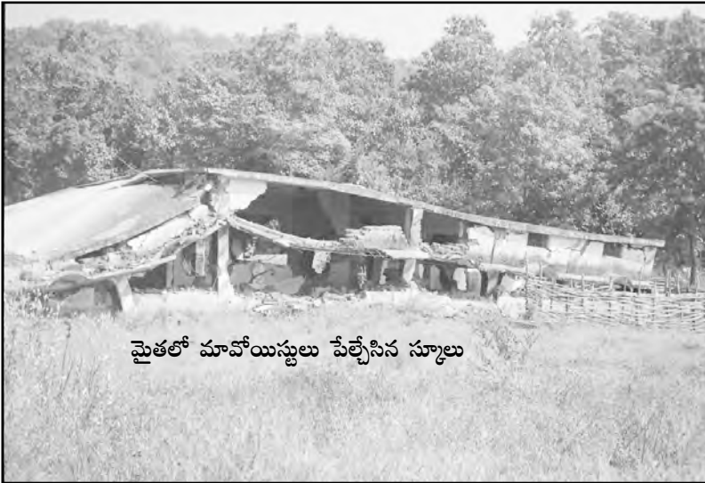
మైతలో మావోయిస్టులు పేల్చేసిన స్కూలు

2006 నవంబర్ 26వ తేదీన మేము మల్లంపేట నుండి దంతెవాడలోకి ప్రవేశించి కుంట తాలూకాలోని పూసుగూడెం, మైత గ్రామాలకు వెళ్ళాము. మైత వద్ద మావోయిస్టులు పేల్చివేసిన అంగన్ వాడి భవనాన్ని, పాఠశాల భవనాన్ని చూశాము. వాటిని పోలీసులు, పారామిలిటరీ విడిదిగా వాడుకున్నందుకు పేల్చి వేయలేదు. అప్పటికింకా అంత లోపలి