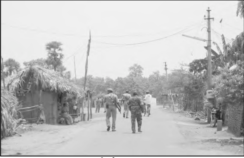
ఎ.పి.మారాయగూడెంలో గస్తీ తిరుగుతున్న సిఆర్పి జవానులు

కుంట - గొల్లపల్లి రోడ్డు. ఇది ఈ మధ్య వుట్టిన రోడ్డు కాదు. ఎప్పటి నుండో ఉంది. కుంట తాలూకా దక్షిణ భాగాన ఉన్న అడవి గ్రామాలను తాలూకా కేంద్రంతో కలిపే ఏకైక రహదారి ఇది. నిజానికి కుంట తాలూకాలో కుంట నుంచి సుక్కు మీదుగా జగ్గల్ పూర్కు పోయే జాతీయ రహదారి నెం. 221 కాక వేరే రెండే రెండు పెద్ద రోడ్లు ఉన్నాయి. ఒకటి కుంటను గొల్లపల్లికి కలిపే రోడ్డు. రెండవది దోర్నపాల్ను జగర్గొండకు కలిపే రోడ్డు. గొల్లపల్లి, జగర్గొండ పోలీసుస్టేషన్లు ఉన్న ఊర్లు.