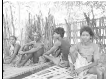
మేం వెళ్ళినప్పుడు అక్కడ కనిపించిన ఒకే ఒక ఆదివాసీ కుటుంబం