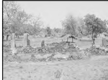
సల్వాజుడువాళ్ళు తగలబెట్టిన గగన్పల్లి గ్రామం

అంత భీకరంగా దాడిచేసి 100 ఇళ్ళు తగలబెట్టినా ఆ ఊరి నుంచి కొద్ది మంది మాత్రమే సల్వాజుడువారి వెంట పోయారనీ మెజారిటీ ప్రజలు తగలబడుతున్న ఆ ఊరిని విడిచిపెట్టి నక్సలైట్ దళాలకు దగ్గరగా అడవి ప్రాంతంలోకి పోయారనీ ఆ ఊరి యాదవులు మాతో అన్నారు.