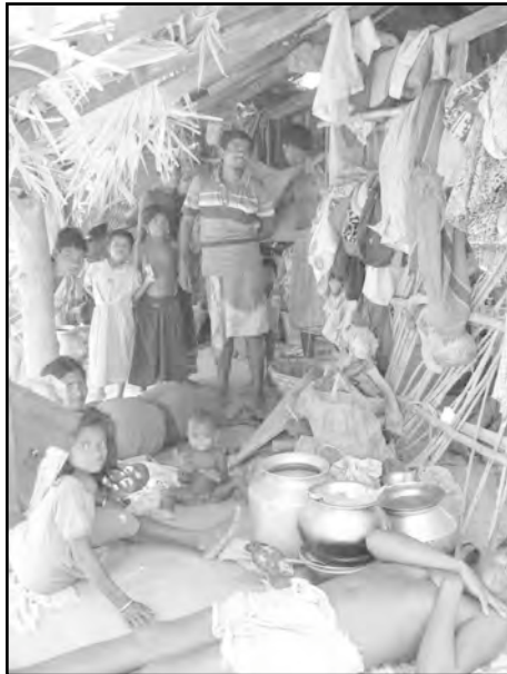
దోర్నపాల్ శిబిరంలో ఈ కుటుంబం ఎంత ఇరుకులో బతుకుతోందో చూడండి

బలవంతంగా అడవుల నుంచి తరలించబడ్డ జనాన్ని రహ దార్ల మీద ఏర్పాటు చేసిన శిబి రాలలో ఉంచారు. 2006 జూలై నెలలో మేము వెళ్ళేసరికి 17 శిబి రాలున్నాయనీ, ప్రభుత్వం లెక్కల ప్రకారం 54,768 మంది వాటిలో ఉంటున్నారనీ పైన చెప్పాము. వాళ్ళంతా పశువుల కొట్టాల వంటి నివాసాలలో ఉంటున్నారు. అప్పట్లో అతి పెద్ద శిబిరాలలో ఒకటైన దోర్నపాల్ శిబిర వాసు లతో మేము వివరంగానే మాట్లా డాము. ఇతర నిజనిర్ధారణ కమిటీ లను దోర్నపాల్ లో సల్వాజుడుం నాయకులు అటకాయించడం, వేధించడం జరిగింది. అయితే మేము వెళ్ళేసరికి మధ్యాహ్నా భోజనం సమయం అయింది.