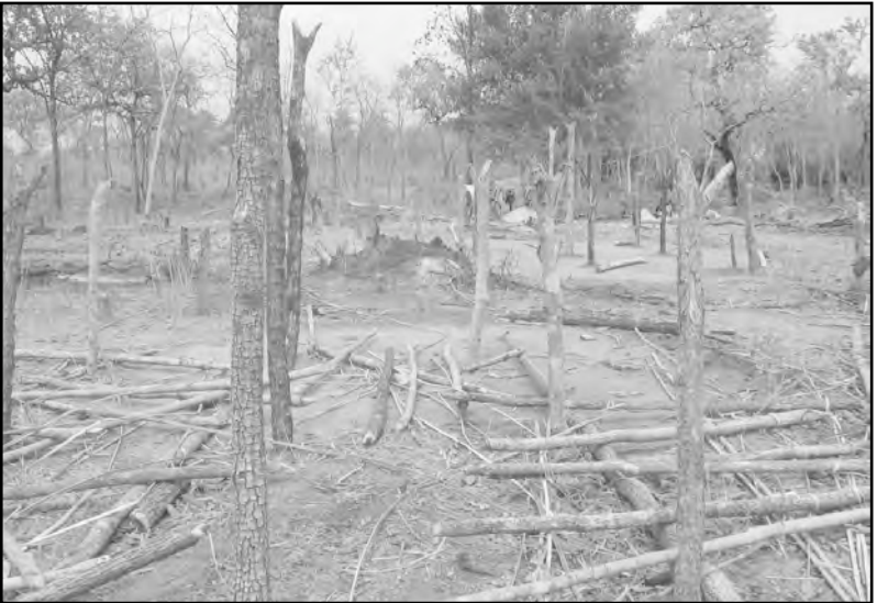
ఖమ్మం జిల్లా సున్నంవారి మట్టికలో అటవీశాఖ కూల్చేసిన ఫర్టీన్గడ్ గొత్తికోయల ఇళ్ళు

ఈ ప్రహసనం నెలకొల్పడానికి సల్వాజుడుం పోలీసులతోనూ పారామిలిటరీతోనూ కలిసి పాల్పడిన హింస, దానిని ప్రతిఘటించడానికి మావోయిస్టులు చేపట్టిన హింస, దంతెవాడ జిల్లాను నిలువునా చీల్చి అంతర్యుద్ధ స్థితిని తీసుకొచ్చిన వైనాన్ని తరువాతి అధ్యాయంలో చూద్దాం. క్లుప్తంగా చెప్పాలంటే రెండేళ్ళ కాలంలో దాదాపు 700 ప్రాణాలు