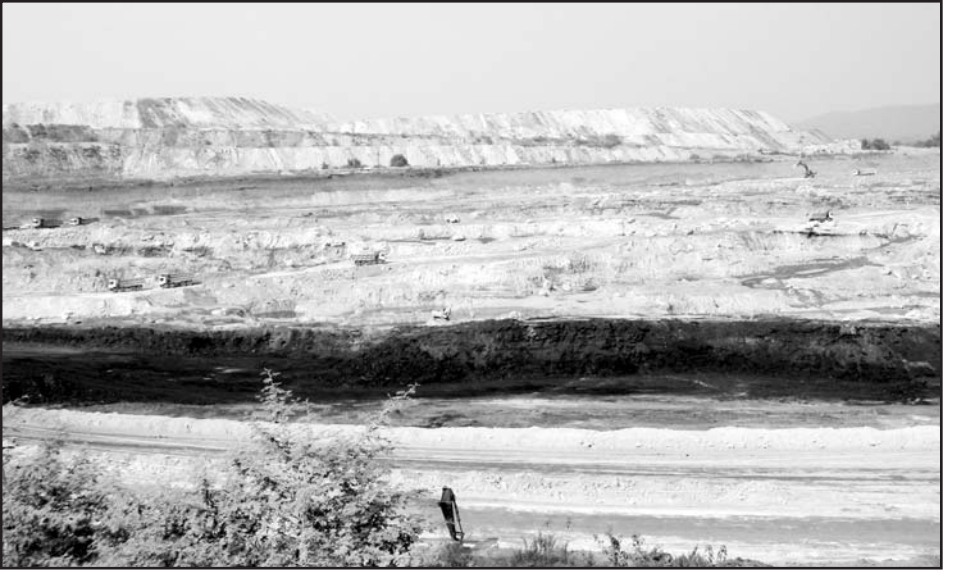
ఆదిలాబాద్ జిల్లా, తిర్యాని మండలంలోని ఖైరిగూడ ఓపెన్‌కాస్ట్

పూర్తిగా ఆపకపోయినా ఓపెన్‌కాస్ట్ ప్రాజెక్టు వల్ల కలిగే నష్టాన్ని ఆందోళన చేసి తగ్గించుకున్న ఉదంతం ఖమ్మం జిల్లా ఇల్లందు పట్టణంలో జరిగింది. జెకె-5 గనిని ఓపెన్‌కాస్ట్‌గా మార్చడానికి సింగరేణి చేపట్టిన భూసేకరణ ఇల్లందు పట్టణంలో 7 వార్డులను మింగేస్తుందని తెలిసి పట్టణ ప్రజలు అఖిలపక్ష కమిటీ ఆధ్వర్యంలో ఆందోళన చేపట్టారు. ఊరిలో భూసేకరణ ప్రధానంగా ఒ.బి. డంప్‌కోసం. ఇళ్లు కోల్పోయేవారు కోల్పోగా మిగిలిన ఊరు పక్కనే పెద్ద మట్టి గుట్టను పెట్టుకొని ఎండాకాలానికి చెలరేగే ధూళిని భరిస్తూ బతకాలి. ఓపెన్‌కాస్ట్‌లో జరిగే బ్లాస్టింగ్ కాలక్రమంలో ఊరంతటినీ శిథిలం చేసినా ఆశ్చర్యంలేదు. జెకె5లో అండర్‌గ్రౌండ్ పద్ధతిలో ఇంకా కొంతకాలం బొగ్గు తవ్వితీసే అవకాశం ఉన్నా కంపెనీ దానిని ఓపెన్‌కాస్ట్‌గా మార్చాలని ఎందుకు నిర్ణయించిందన్న ప్రశ్నకు జవాబేమీ లేకున్నా, ఆందోళన ఫలితంగా భూసేకరణను తగ్గించడమయితే జరిగింది. ఇప్పుడు ఇల్లందు పట్టణంలో 7 వార్డుల కాదు, 2 మాత్రమే పోతాయి. అయినప్పటికీ ఆ పట్టణ భవిష్యత్తు ప్రశ్నార్థకంగానే ఉండిపోయింది.